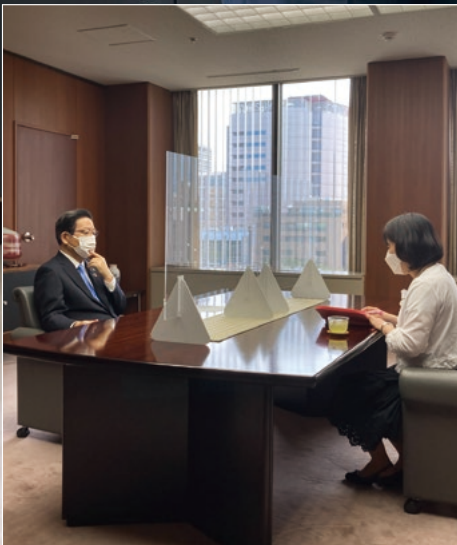
▲北橋健治北九州市長へのインタビューは3ページに掲載しています。